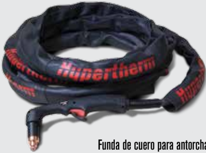
Funda de cuero para antorcha