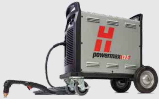
Juego de ruedas