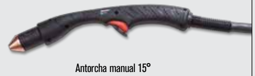
Antorcha manual 15°