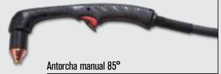
Antorcha manual 85°

(para ver más opciones de antorchas, visite www.hypertherm.com )