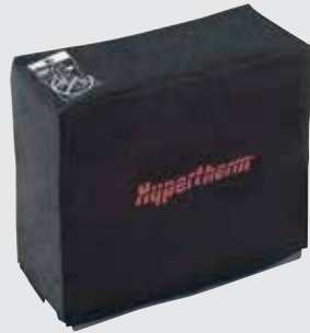
Cubierta contra el polvo para el sistema