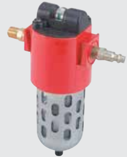
Juego de filtración de aire