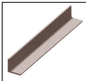
Laminado en caliente