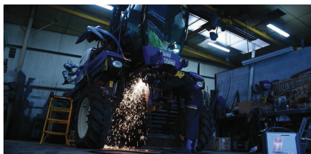
Mantenimiento de equipos agrícolas