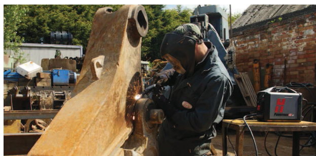
Mantenimiento y reparación