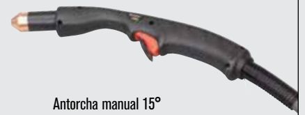
Antorcha manual 15°