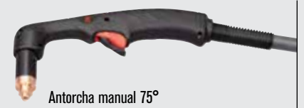
Antorcha manual 75°

(visitar www.hypertherm.com para más opciones de antorchas)